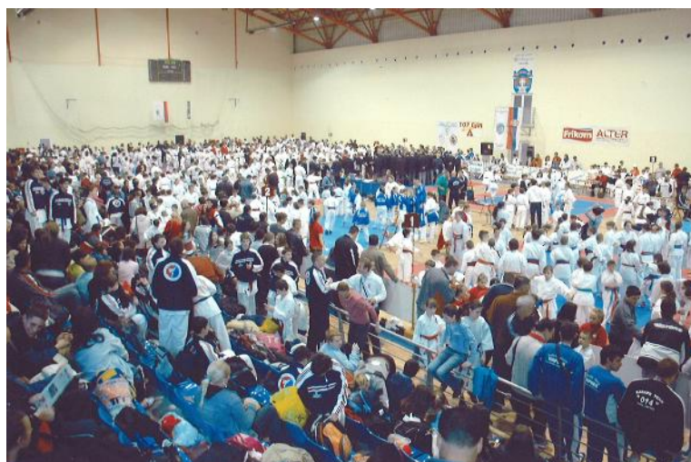
Zlatni pojas 2013.