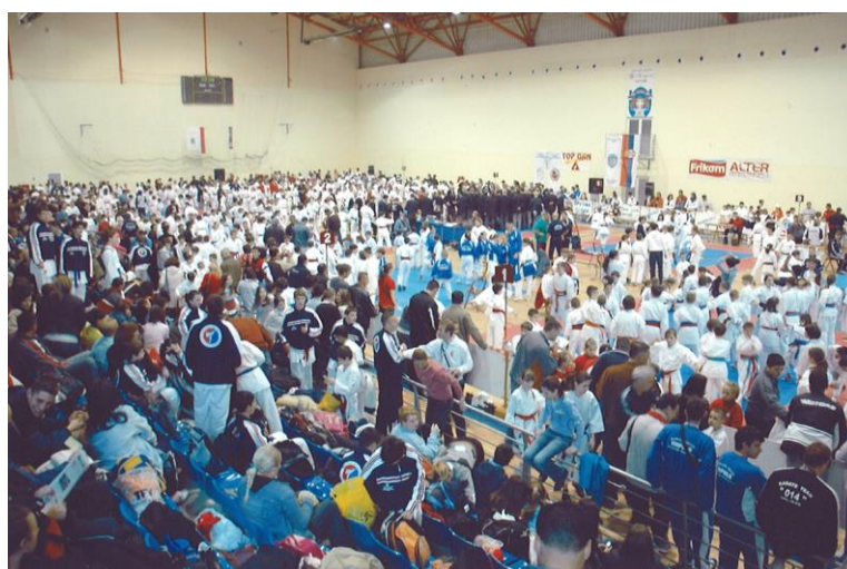
Zlatni pojas 2014.