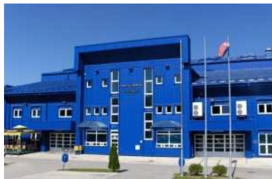
Sportski centar "Mladost" - Atenica

Sportska dvorana "Mladost" je svečano otvorena u oktobru 2005. godine. Izgrađena je na lokaciji nekadašnjeg otvorenog rukometnog terena u Atenici i predstavlja sportsku dvoranu izgrađenu po svim normama i propisima za održavanje međunarodnih sportskih događaja. Od svog otvaranja je postala dom mnogobrojnih čačanskih sportista, a kapacitet dvorane je 1100 mesta za sedenje.