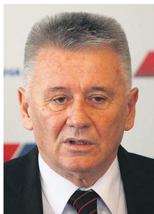
Počasni predsednik OK Velimir Ilić Ministar u Vladi RS